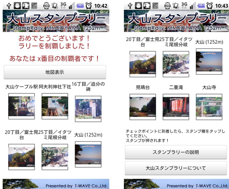
図 2 大山スタンプラリー スタンプラリー台帳(例)