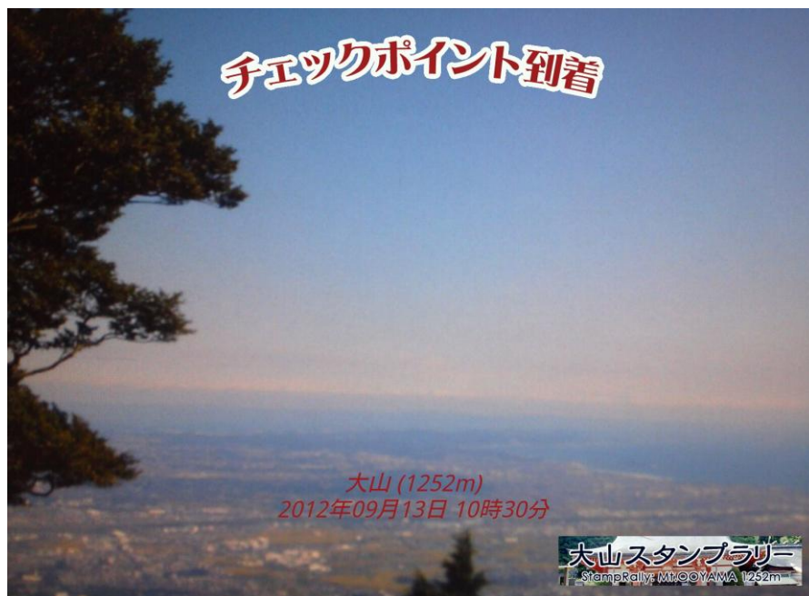
図 3 大山スタンプラリー チェックポイント到達写真(例)