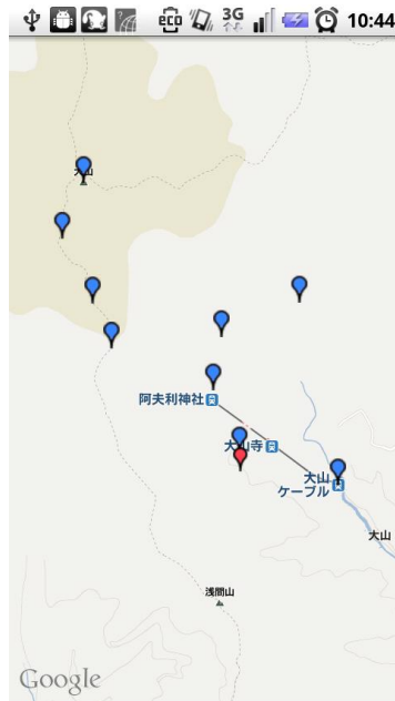
図 4 大山スタンプラリー 地図(例)