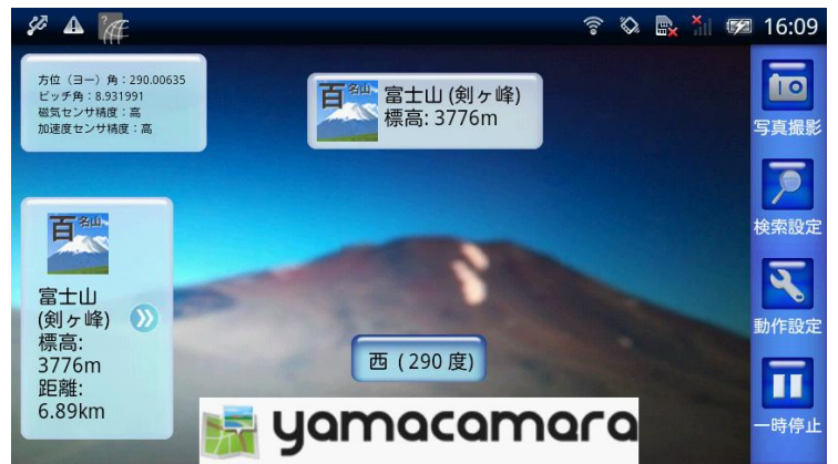
図 2 精度が高いときのコンパス情報(たてモード／よこモード)