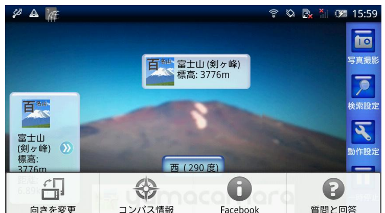
図 5 自動回転設定オフ時のメニュー(たてモード/よこモード)