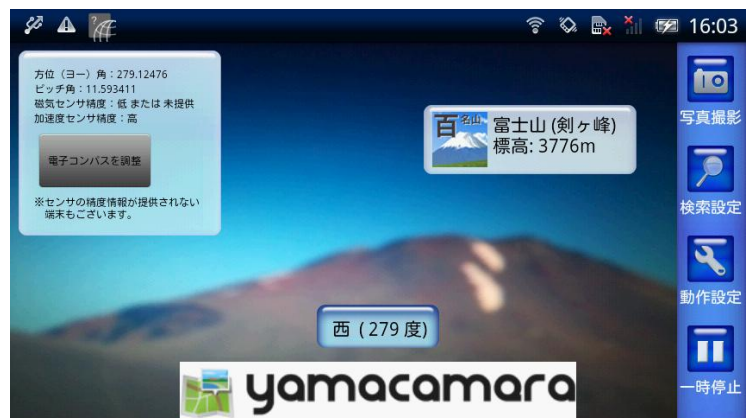
図 3 精度が低いときのコンパス情報(たてモード／よこモード)